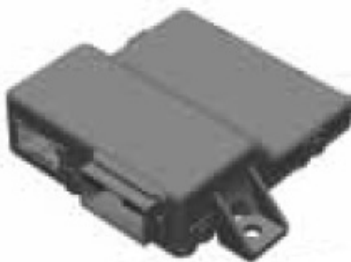
① ゲートウェイ コントロールユニット