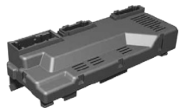
③ リヤリッド コントロールユニット