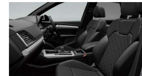
スポーツシート(フロント)/ファインナッパレザー ダイヤモンドステッチ