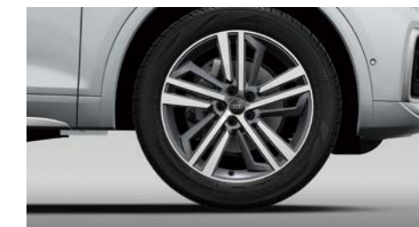
アルミホイール 5セグメントスポークデザイン コントラストグレーポリッシュ 8J×20+255/45R20タイヤ